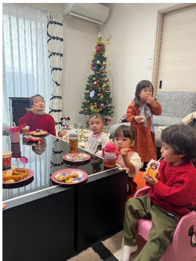
(2022年12月 クリスマス会 参加:5組)