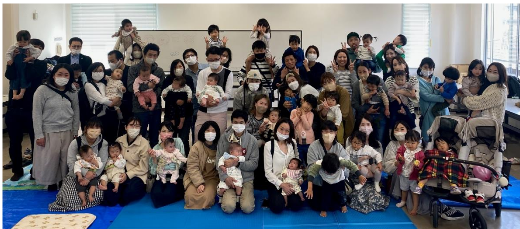
(2023年4月 参加 24組 76名) 開催場所:大和郡山市民交流館「きんぎょの駅」