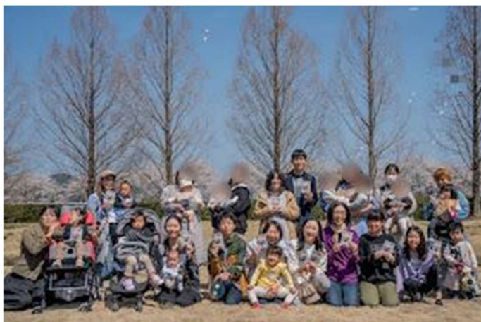
お花見交流会 2023@近江八幡 びわこリトルベビーハンドブックを 持って記念撮影