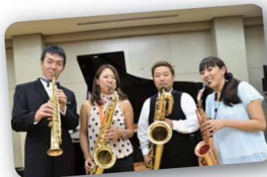
Kafuu Saxophone Quartet (カフー・サクソフォン・カルテット) サクソ4重奏

HANDSは保健医療の国際協力をおこなう団体です。東日本大震災では、陸前高田市を中心に、予防接種や健診のお手伝い、子育て支援団体のサポートをしています。コンサートの収益金は、親子をささえる子育て支援団体の活動資金として役立ちます。